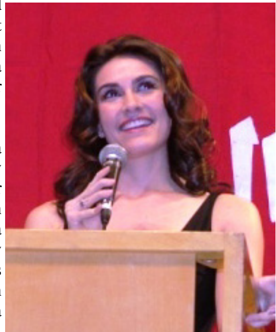
Nazanin Afshin-Jam, Miss Canada 2003, och människorättsaktivist

Nazanin frigavs till slut den 30 januari från fängelset i Teheran. Hon återsåg friheten efter en omänsklig döds kamp i 3 års tid. Att i 3 ständiga år, närmare 1000 dagar, räkna sekunderna marschen mot den avskyvärda lyftkranen, dödens kran, måste räknas som brott mänskligheten, inte minst med tanke på att detta ofattbara brott har begått mot ett barn, en 17 årig flicka, som inte bara har förlorat tre år av sina